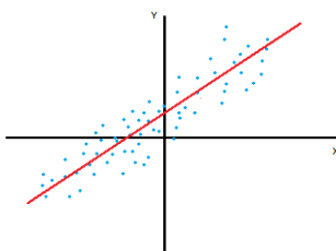
Figura 1. Ilustración: \mathbb{R}^2 \rightarrow \mathbb{R}

La estimación del componente principal obedece a la combinación lineal de un grupo de variables, expresado en el aporte de variabilidad de cada una, donde se identifica la cercanía entre ellas y su grado de similitud. Esto se ve representado en las figuras 1 y 2, en la que cada punto constituye la variable en un espacio geométrico \mathbb{R}^k de k dimensiones, con el fin de estudiar las características de manera sintética.