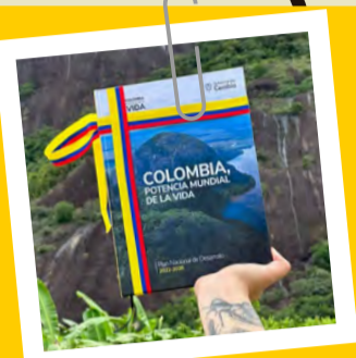
Bases del Plan Nacional de Desarrollo 2022-2026 Colombia Potencia Mundial de la Vida, p. 154.

... se garantizará la justicia y el acceso a la información en asuntos ambientales, en el marco del Acuerdo de Escazú, y se cumplirán los principios rectores sobre las empresas y los derechos humanos de las Naciones